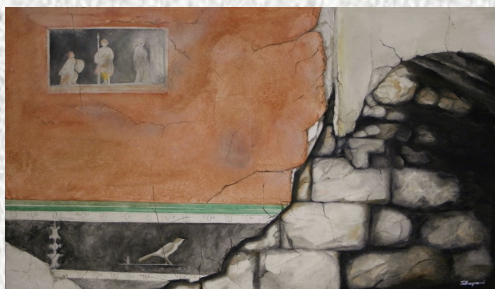
Olio su tela cm 80x120

Durante l' inaugurazione, (sabato 21 alle ore 17:00) si effettuerà una visita agli scavi, per ammirare gli affreschi originali dai quali l'artista Tullia Caporicci ha tratto ispirazione.