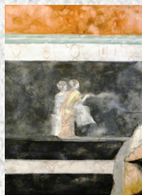
Acquerello su tela Cm 60 X 80